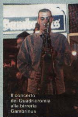
Il concerto dei Quadricromia alla birreria Gambrinus