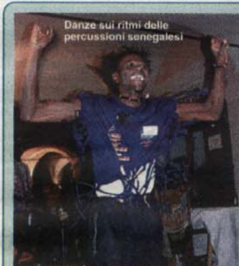
Danze sui ritmi delle percussioni senegalesi