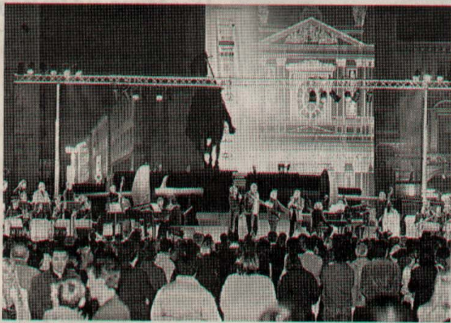
La festa di chiusura con la sfida fra la Jazz Orchestra e la Civica Jazz Band di Milano

BYE BYE TORINO IL CONCERTO SWING IN PIAZZA SAN CARLO HA CONCLUSO IERI SERA L'EDIZIONE PIÙ VISTA