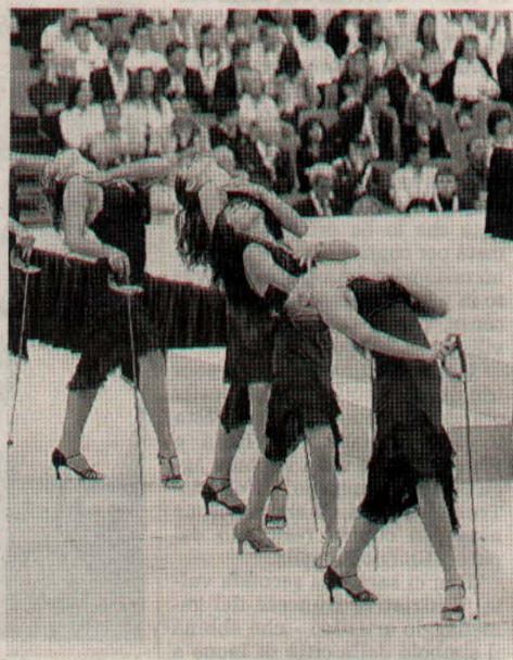
La cerimonia d'apertura aveva richiamato 48 mila persone